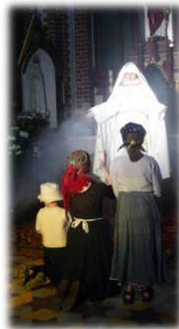
W trakcie odgrywania scenki