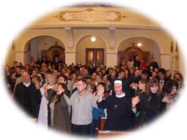
s. Dalmacja wraz z rozśpiewaną młodzieżą