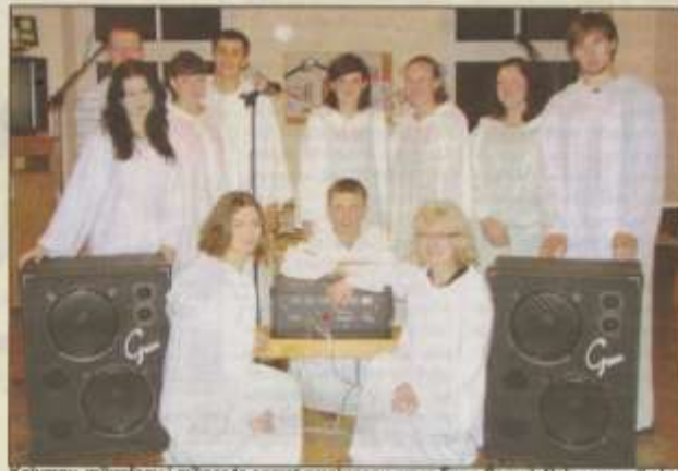
Kolumny, mikrofony i mikser to sprzęt przekazany przez firmę Cerpol. Nobsa wsparli również parafianie. Ofiarowali grupie prawie 3 tysiące złotych.

Kierownictwo Cerpola skontaktowało się z naszym