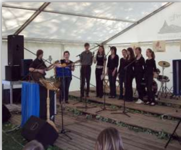
Zespół NOLS na scenie w Radłowie