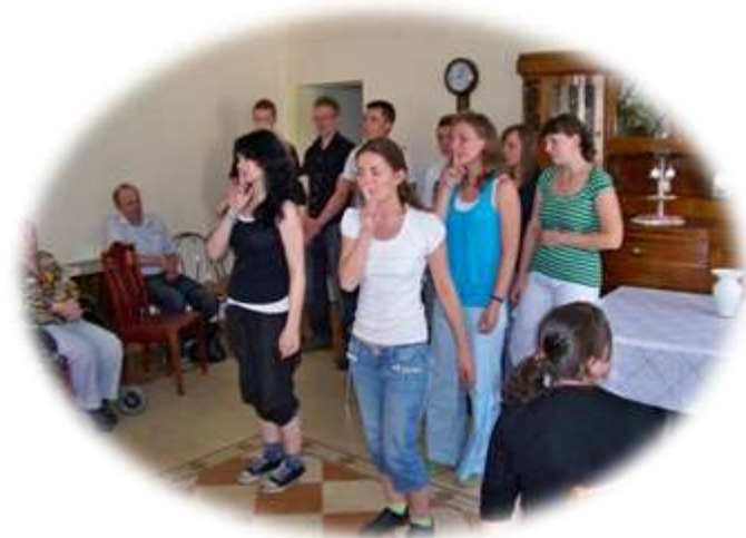
Zespół podczas występu