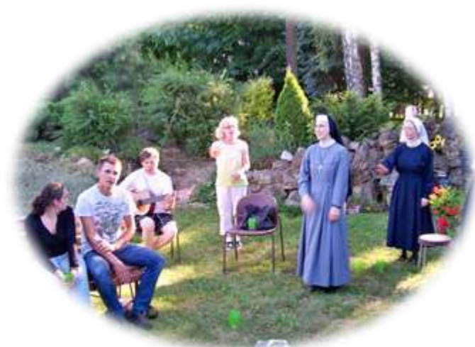
Spotkanie z siostrami nowicjuszkami w Leśnicy Opolskiej