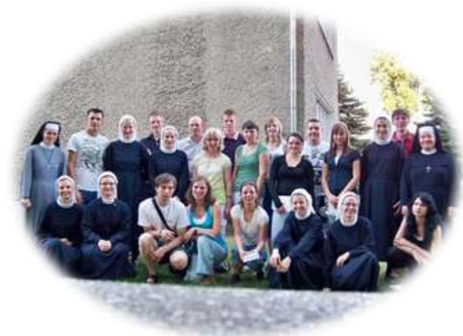
Wspólne zdjęcie zespołu z nowicjuszkami w Leśnicy Opolskiej