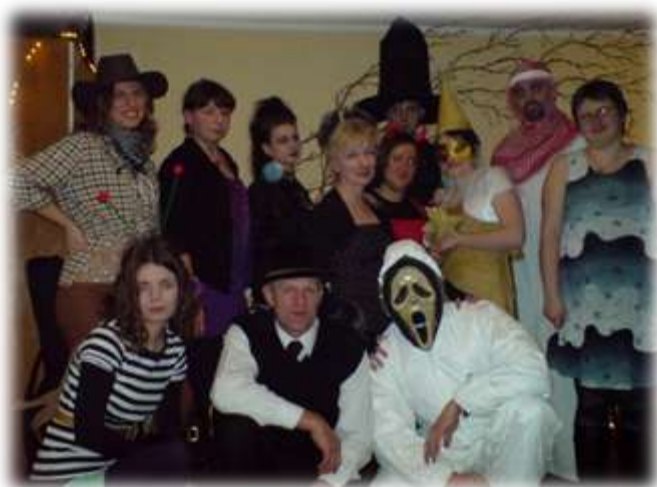
Wspólna fotografia wszystkich uczestników zabawy sylwestrowej w przebraniach

31 grudnia 2010 roku grupa NOLS zorganizowała zabawę sylwestrową w salce DFK. Podczas imprezy obowiązywało przebranie. Wszyscy z radością przywitani Nowy Rok przy dźwiękach pieśni religijnych, a także występów karaoke.