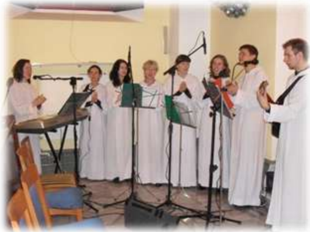
ŃOLS podczas występu w Leśnicy Opolskiej