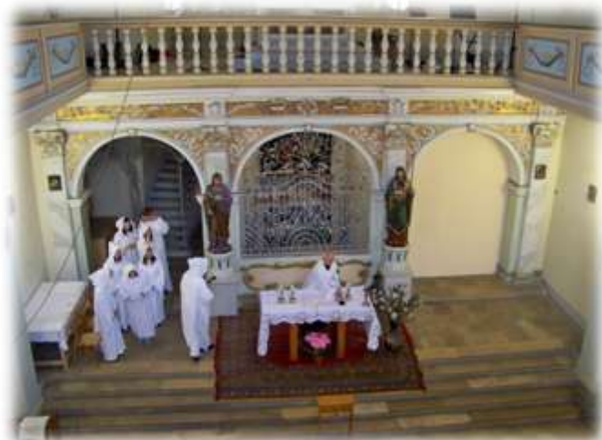
Zespół NOLS przygotowujący się do występu

8 sierpnia 2010 r. Zespół NOLS organizuje nabożeństwo Maryjne, oraz adorację Najświętszego Sakramentu w Kościółku przy klasztorze i domu opieki prowadzonym przez siostry służebniczki w Porebie.