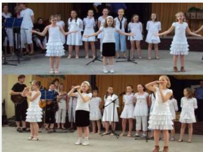
Zespół wraz z ze scholą na Dniach Gorzowa

Kolejny występ zespołu poza murami kościoła to gorzowski amfiteatr. 12 czerwca 2010 roku grupa zostaje zaproszona, aby wystąpić na Dniach Gorzowa.