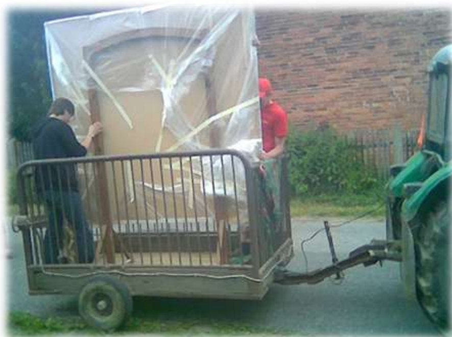
Transport obrazu z Zofiówki do gorzowskiego kościoła