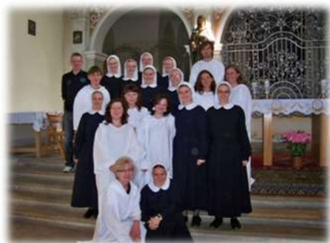
Zespół wraz z siostrami nowicjuszkami