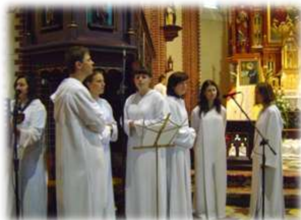
Zespół podczas śpiewu na mszy szkolnej