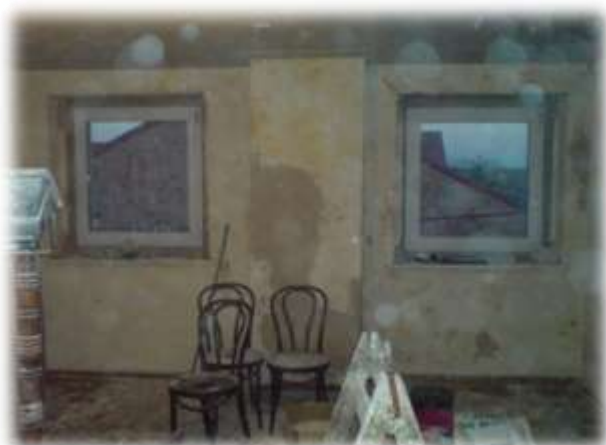
Salka przed remontem