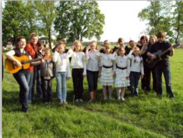
Zespół wraz ze scholą dziecięcą w Radłowie

23 maja 2010 roku zespół zostaje zaproszony na festiwal piosenki religijnej do Radłowa (gmina Olesno). NOLS wystąpił razem z dziećmi, scholą parafialną z Gorzowa Śląskiego. Koncert odbył się w specjalnie postawionym namiocie, w warunkach plenerowych, z udziałem zespołów z wielu innych miejscowości, a także z zagranicy.