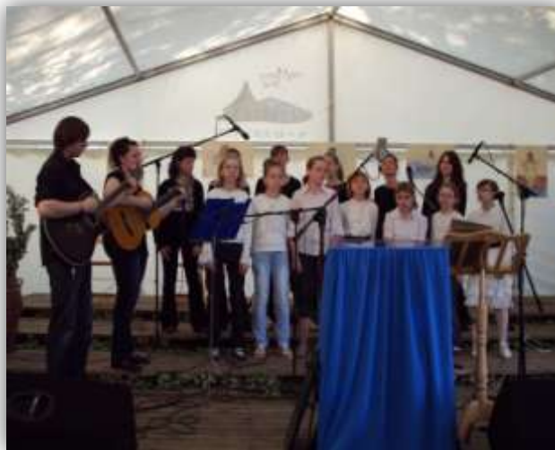
Podczas występu ze scholą