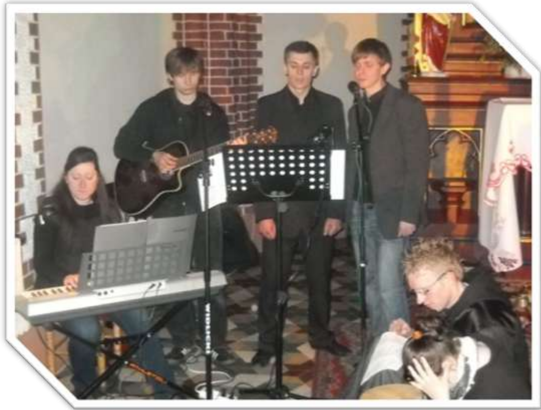
Nowi członkowie zespołu podczas jednej z prób