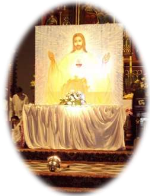
Obraz Serca Jezusa namalowany przez Monikę Jablonka