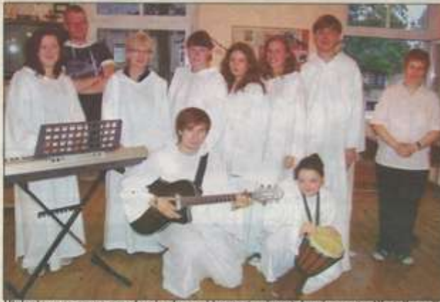
Utalentowana grupa przed wyjazdowymi koncertami spotyka się często. Nie tylko szlifuje repertuar, ale też z przyjemnością spędza czas w przyjacielskim gronie.

Wspólne muzykowanie grupie spodobało się tak bardzo, że już podczas pierwszego czuwania postanowili pokazać się parafianom.