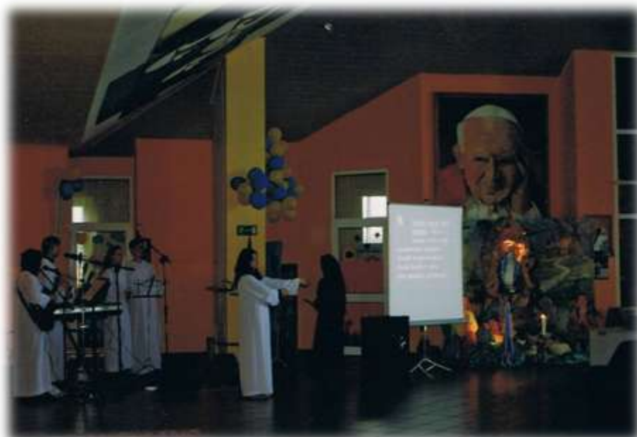
Zespół ŃOLS podczas śpiewu na uroczystości I Komunii