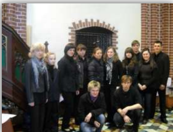
Wspólne zdjęcie zespołu po czuwaniu