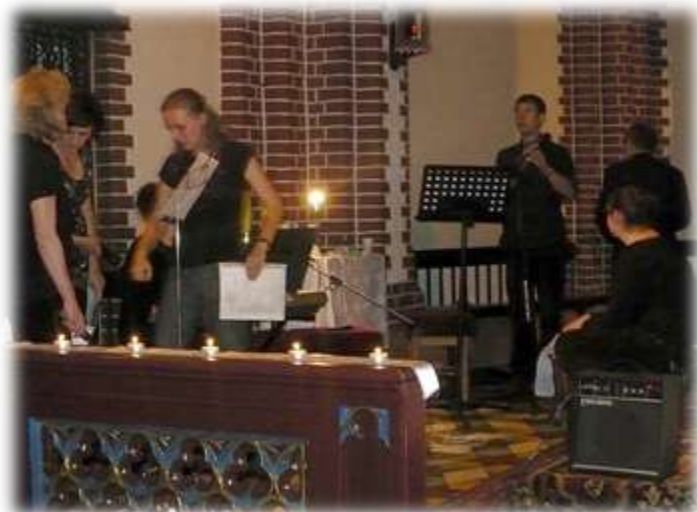
Grupa przed czuwaniem o Bożym Miłosierdziu