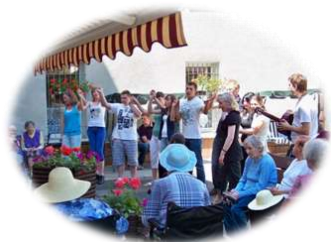
Występ przed ośrodkiem w Porebie