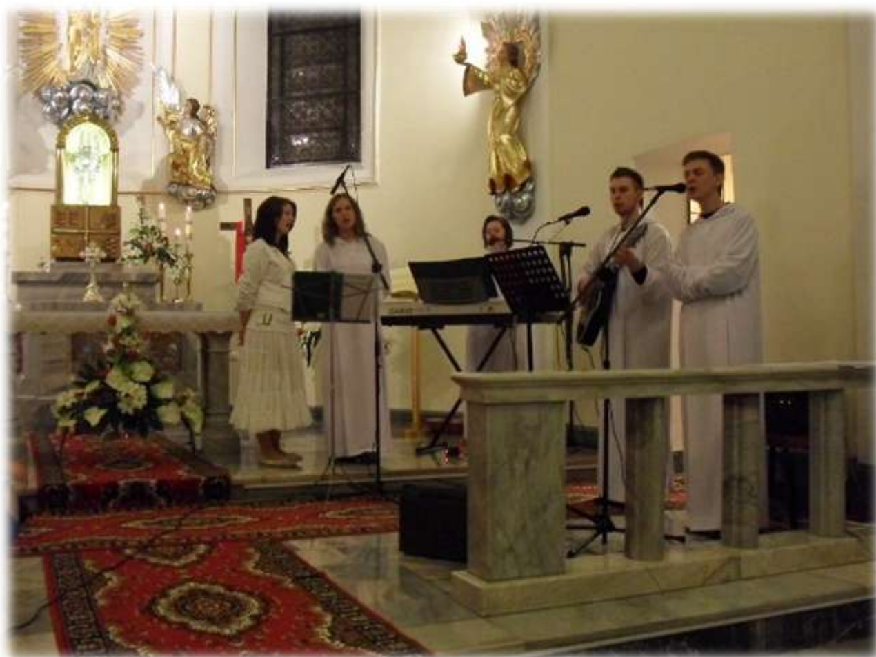
Zespół ŃOLS podczas czuwania