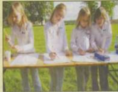
One Day to miejscowy zespół. Mali artyści po występie wzięli się za malowanie aniołów.