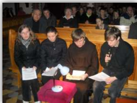
Podczas prezentacji multimedialnej o krzyżu San Damiano