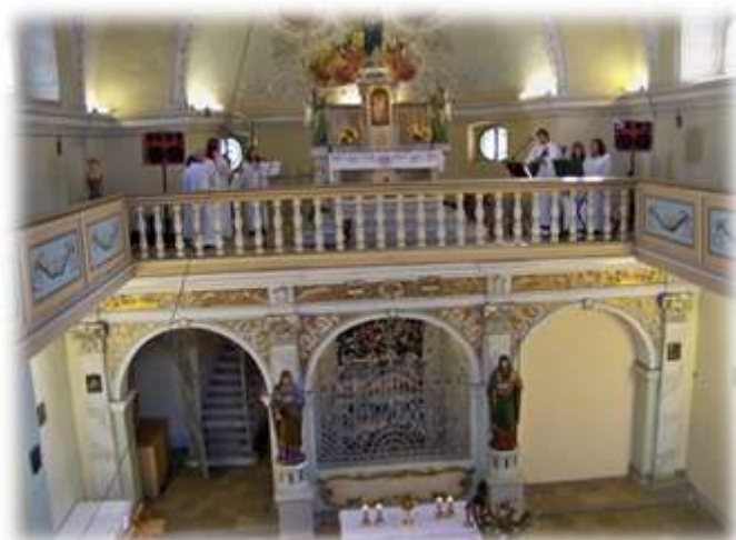
Występ w porebskim kościele